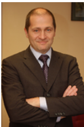
Kríza Ákos Miskolc polgármestere